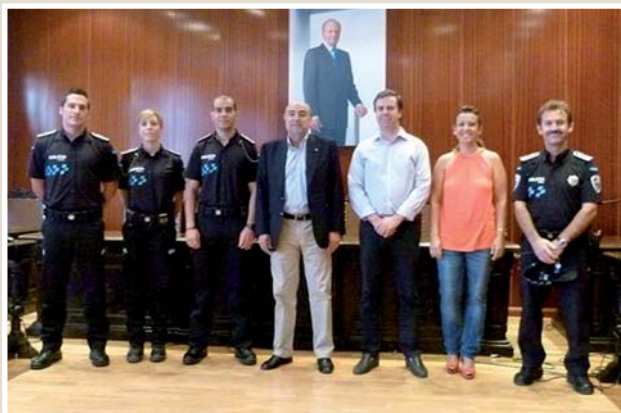
Dos varones y una mujer fueron nombrados Policías Locales el pasado 20 de julio tras superar la oposición libre convocada por el Ayuntamiento.