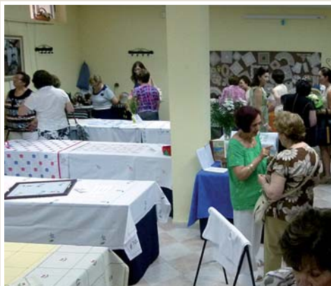
La Asociación Amas de Casa de Manzanares celebró su fiesta de fin de curso, en la que se inauguró una exposición con algunos de los trabajos de sus integrantes.