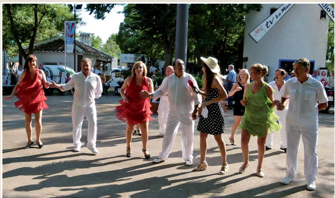
El programa de RTVCM, Ancha es Castilla-La Mancha , se detuvo en Manzanares durante el mes de julio para mostrar a toda la región las posibilidades de ocio, cultura y promoción económica de la localidad.