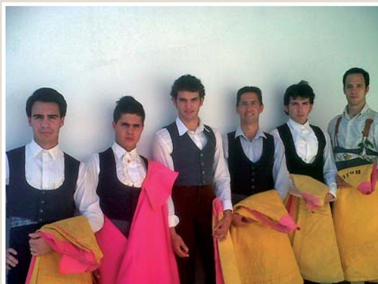
La escuela taurina de Ciudad Real impartió una clase práctica para los jóvenes de la localidad con cinco hembras de la ganadería de Herederos de Clemente Parra.