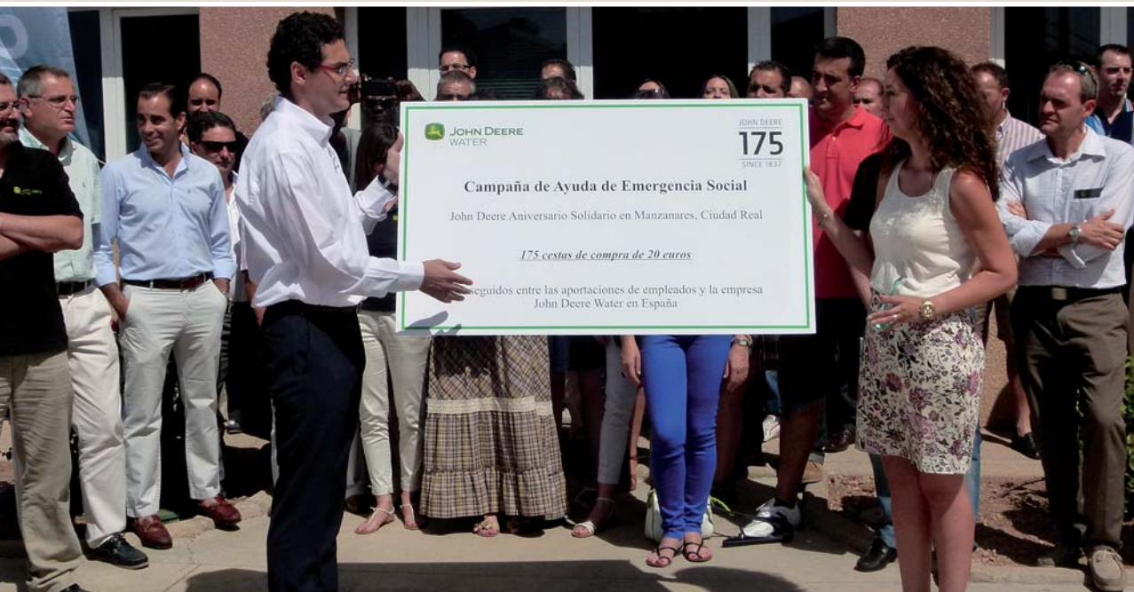
La empresa John Deere Water, afincada en Manzanares, celebró su 175 aniversario con la entrega de 175 vales de alimentos destinados a las familias más necesitadas de la localidad.