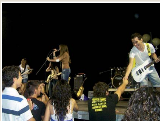
La Plaza de la Constitución fue el escenario de la IV Semana del Rock, que tuvo su punto culminante con el concierto celebrado el día 21 de julio bajo el nombre de "La música toma la calle".