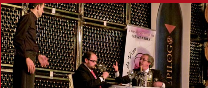
Clausura Alma del Vino 2012 (arriba). Vaya Cirio teatro (abajo).

Para cerrar un fin de semana con marcado carácter vitivinícola, la compañía local de teatro Vaya Cirio representó un divertido sketch bajo el título de 'Las apariencias engañan'.