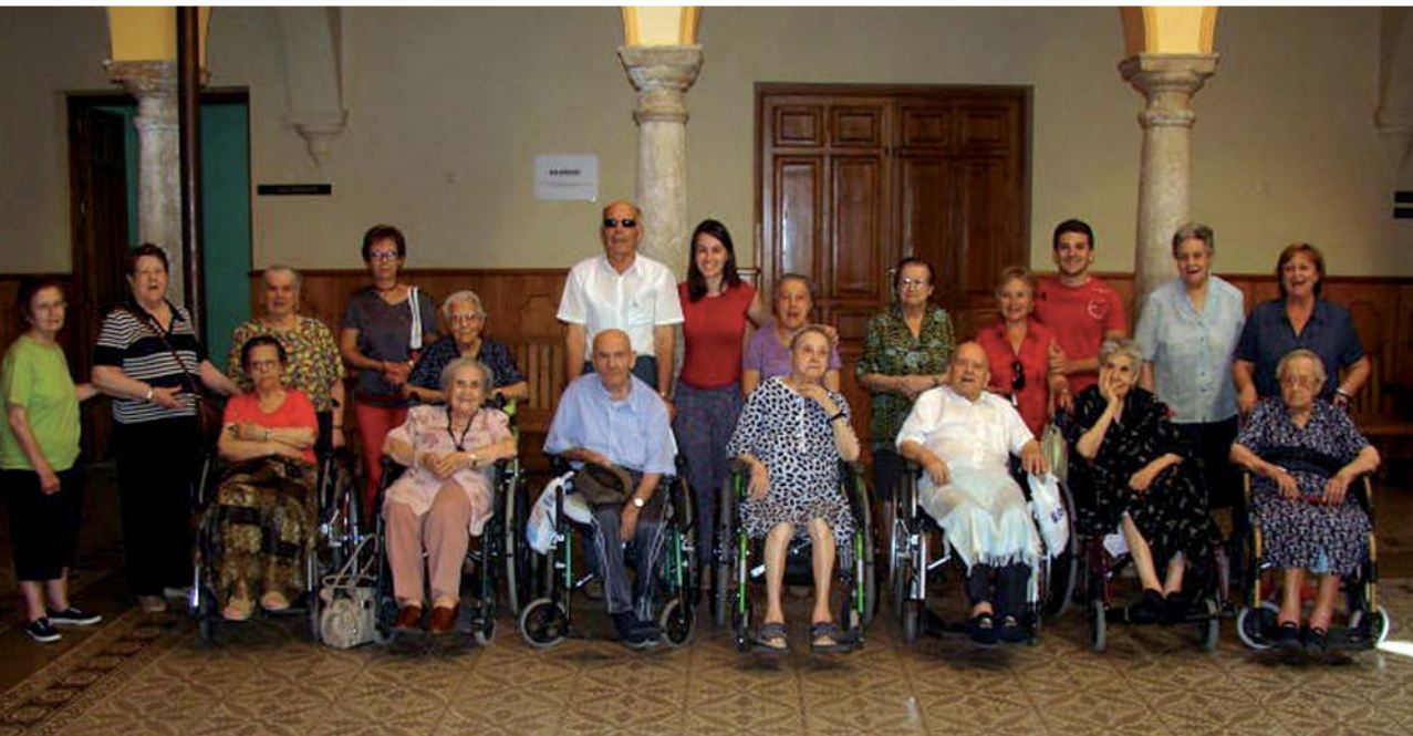
Quince residentes de La Milagrosa tuvieron la oportunidad de efectuar una visita guiada por el museo Manuel Piña situado en el Centro Cultural Ciega de Manzanares.