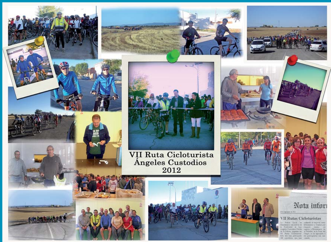
VII Ruta Cicloturista Ángeles Custodios 2012