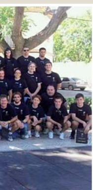
Los Institutos de Educación Secundaria Azuer y Sotomayor recibieron una charla organizada por el área de Promoción Económica del Ayuntamiento para que sus alumnos tuvieran unas nociones básicas de lo que es el autoempleo.