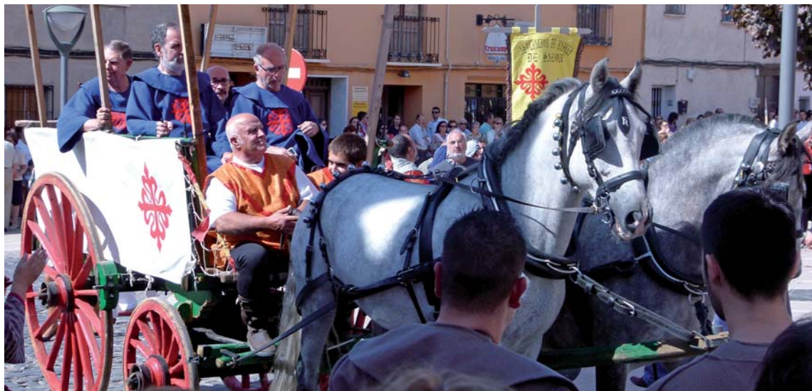
Llegada de los alcaldes medievales.