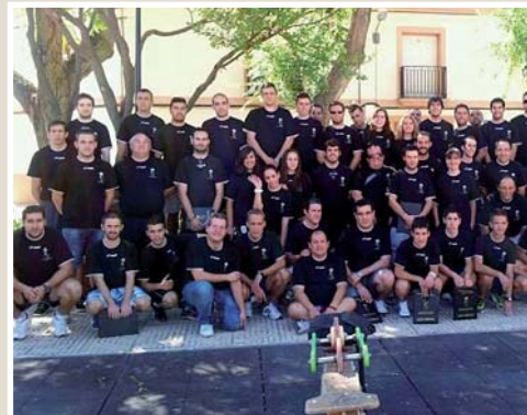
Manzanares acogió en septiembre el stage de pretemporada arbitral de la Federación de Balonmano de Castilla - La Mancha. En total, 75 árbitros afrontaron las pruebas físicas y una serie de charlas informativas.