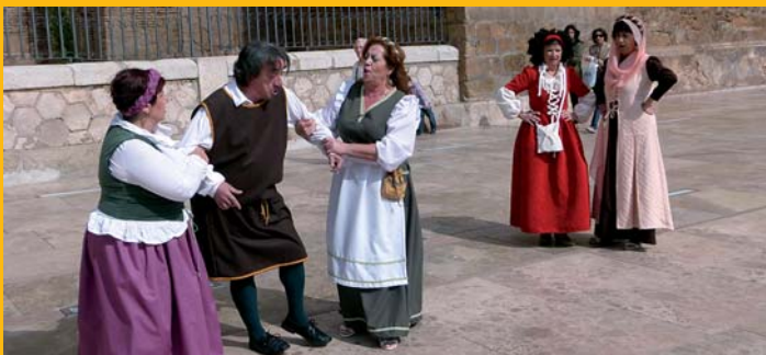
Bailes y actuaciones en las plazas de Manzanares.

La Historia 'académica' también tuvo su momento en la sala de exposiciones del Gran Teatro con la muestra 'VIII Centenario de la Batalla de las Navas de Tolosa', que repasó uno de los momentos clave de la Reconquista en el siglo XIII. La exposición contó con láminas con texto e imagen conmemorativas de una batalla en la que las tropas cristianas derrotaron a las musulmanas.