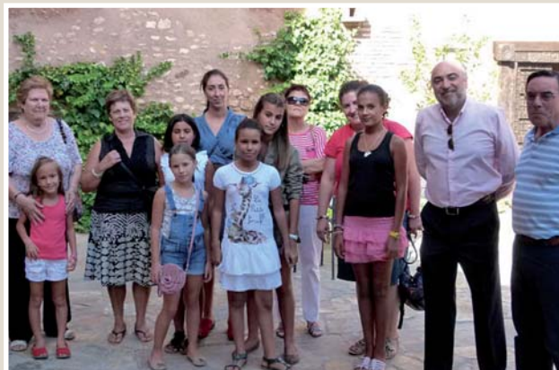
Las niñas saharauis que pasaron el verano en la localidad se despidieron de Manzanares con una visita guiada al Castillo de Pilas Bonas en la que conocieron la historia de la fortaleza.