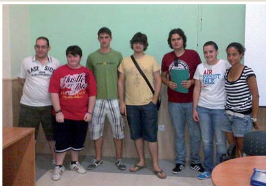
La XXI Asamblea del Consejo Local de la Juventud dio como resultado la constitución de la nueva comisión permanente que dirigirá el rumbo de la institución durante los próximos dos años.