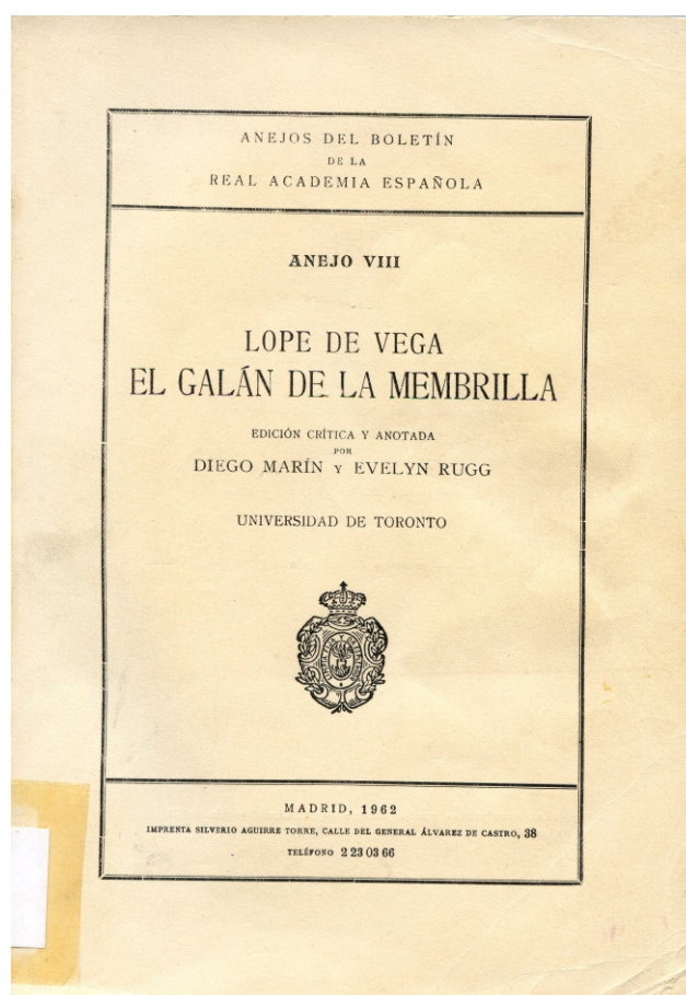
Edición de 1962. Madrid. Real Academia Española.