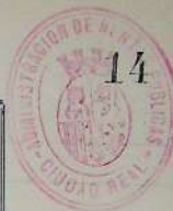
Figura a continuación, el siguiente informe:

La Comisión municipal de Hacienda que suscribe, vistas las cuentas que preceden que se presentan firmadas de conformidad por el Interventor de la Administración, las encuentra conformes y propone al Excmo Ayuntamiento se sirva acordar su aprobación. = La Corporación no obstante acordará lo que estime más conveniente. = Manzanares trece de Julio de mil novecientos treinta y cuatro. = Siguen las firmas de la Comisión.